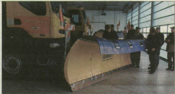
Saját hókotrókkal is rendelkeznek