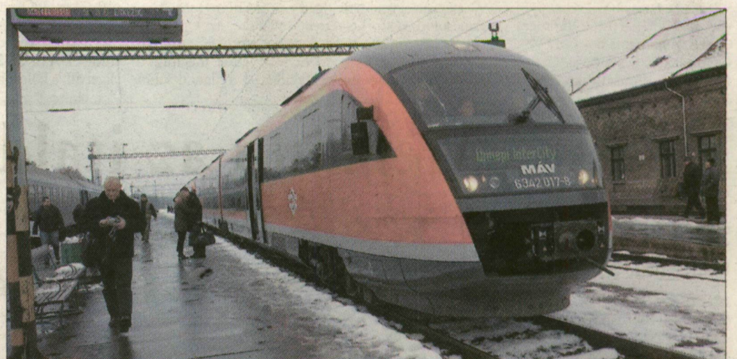
A MÁV egyetlen igazán korszerű motorvonata csak vendég a Dél-Alföldön

Néhány napig Kelet-Magyarország nagyvárosai között járnak a MÁV Siemens Desiro típusú vonatai. Az ünnepi menetrend jelentősen lerövidíti a menetidőt Debrecen, Nyíregyháza és Miskolc felé.