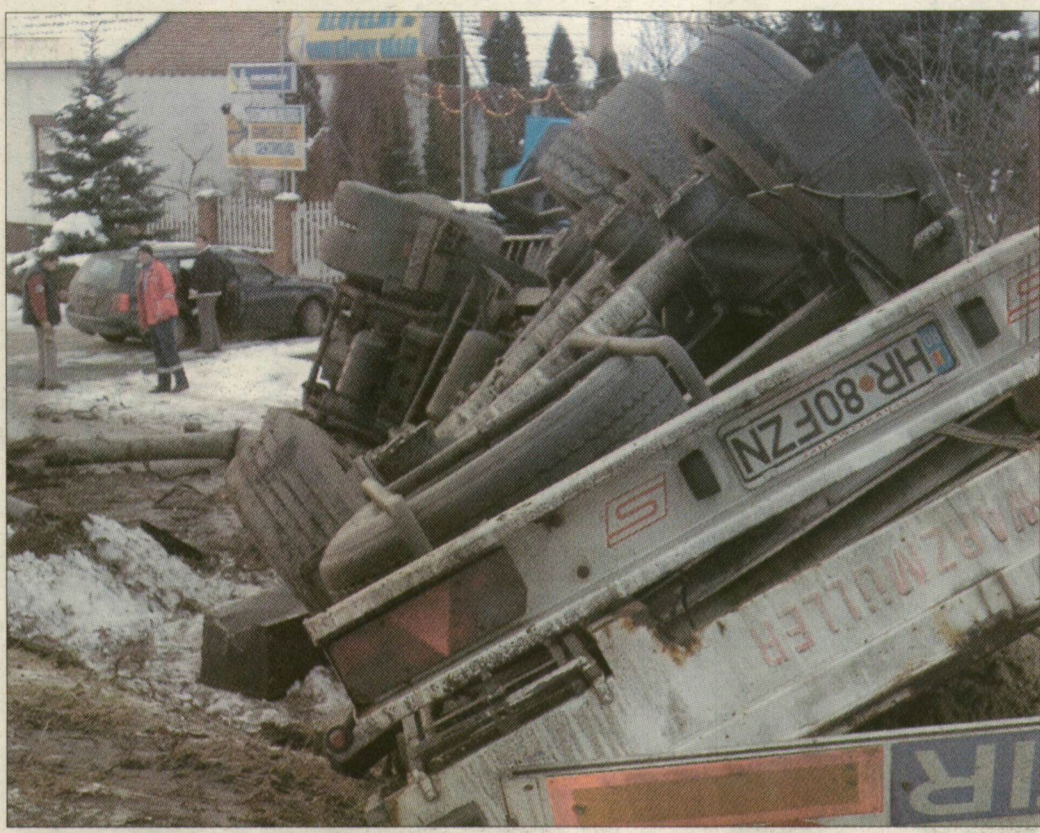
Tegnap hajnalban egy csíkszeredai cég kamionja borult fel a gyalogosvédő szigetenél