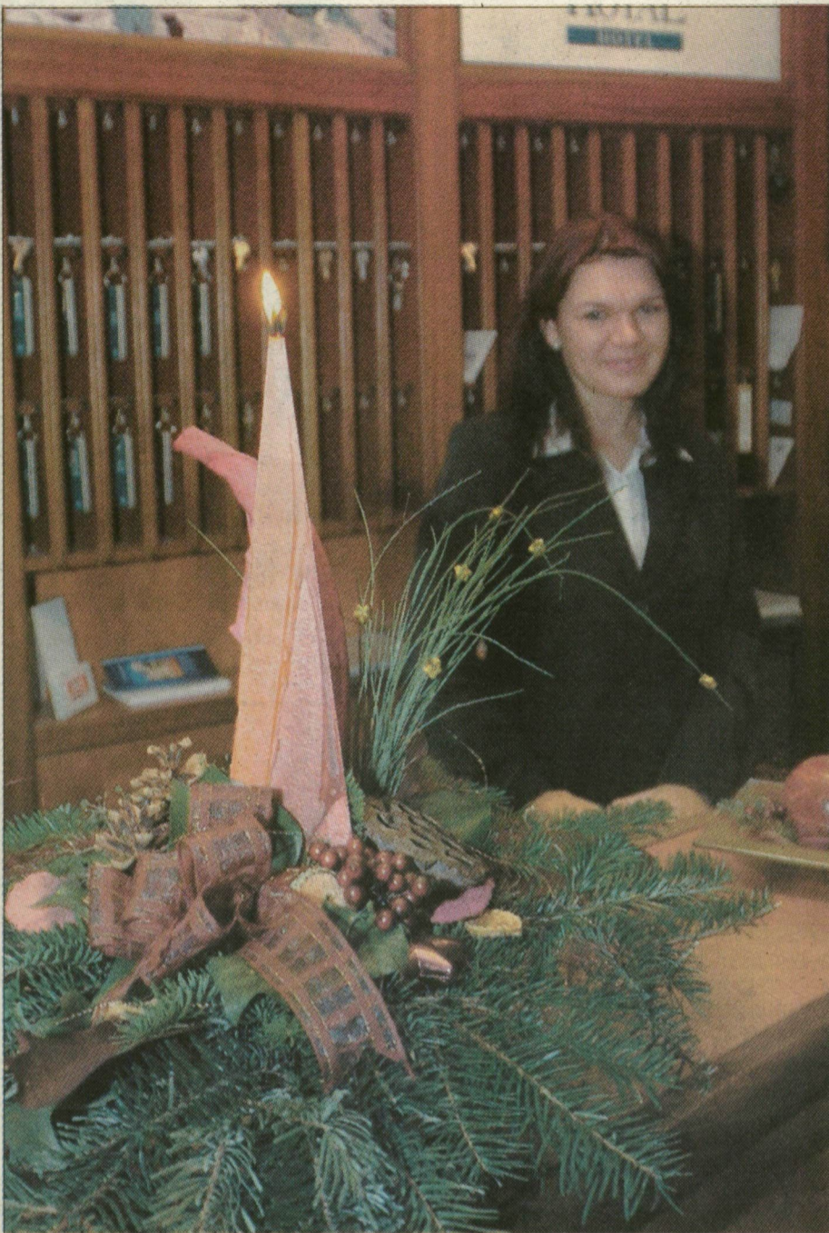
Ünnepi díszben a Royal Hotel recepciója

A szegediek közül viszont egyre többen választják az utazást az ünnepek alatt. Főként a