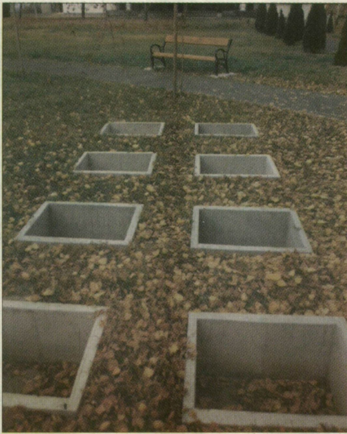
Hatszemélyes családi urnasír az első parcellában. Fotó: Gyenes Kálmán

– A hozzátartozók az előcsarnokban gyülekeznek, majd melléjük, az üvegfalal és függőnyvel elválasztott szomszédos terembe tolnak az elhunytat – vezetett körbe Hódi Lajos ügyvezető. A rokonok és barátok hamvasztás előtt az üvegen át vehetnek búcsút. Tíz-tizenöt perc után a holttestet az égetőkemencébe viszik és megkezdődik a hamvasztás. Ezt a másfél órát a rokonság kivárhatja. A családtagok ültethetnek a büfébe, ahol üdítőt, kávét és aprósüteményt fogyasztva beszélgethetnek. Az igazgató hangsúlyozta: nem halotti tor rendezésére vállalkoznak, de szívesen segítenek ké-