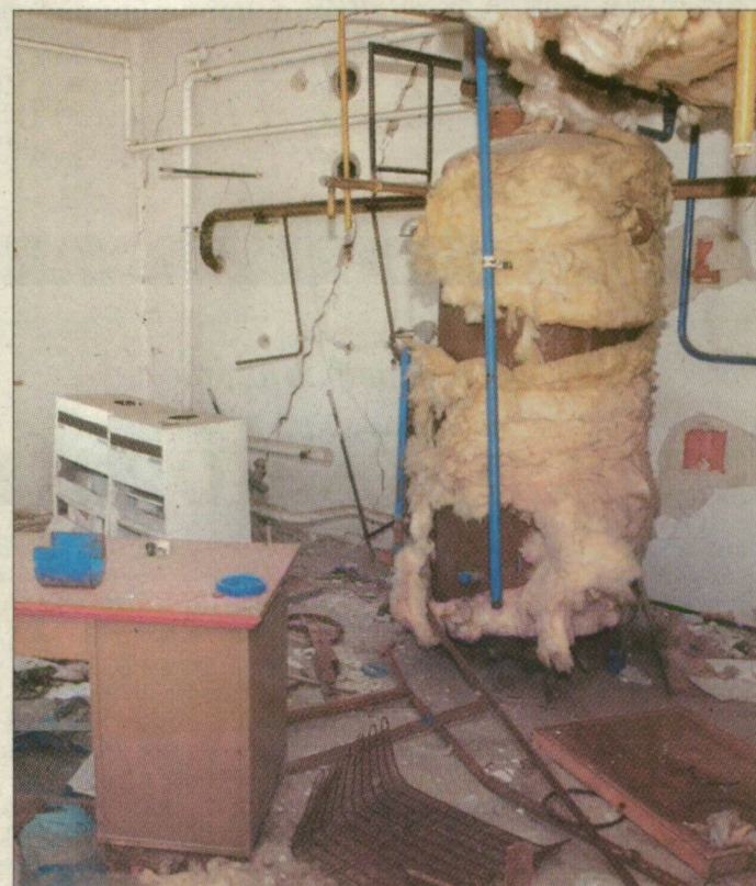
A gyógyintézetre az elmúlt évtizedben nem sokat költöttek a város.