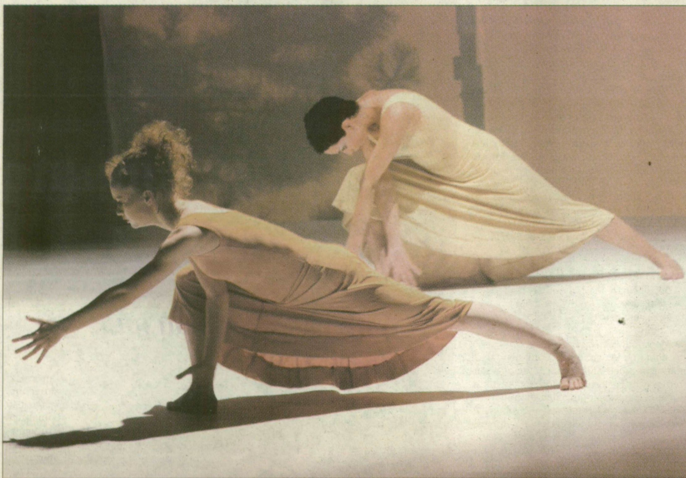
A budapesti modern táncszínházban mutatták be a Liszt zenéjére komponált művet