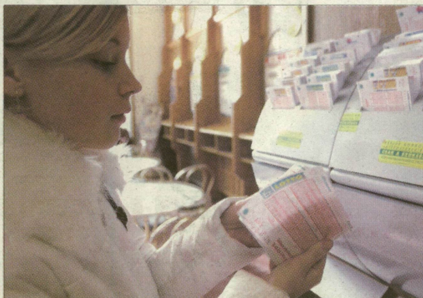
A szülők hiába küldik el a lottózókba a gyerekeket, a 18 év alattiakat nem szolgálhatják ki

További újdonság, hogy ezentúl fiatalkorúaknak szóló sajtótermékekben sem szabad szerencsejátékot reklámozni. A játéktérmetekre is új szabályozás vonatkozik: ha az adott egységet fiatalkorú is látogatja, az