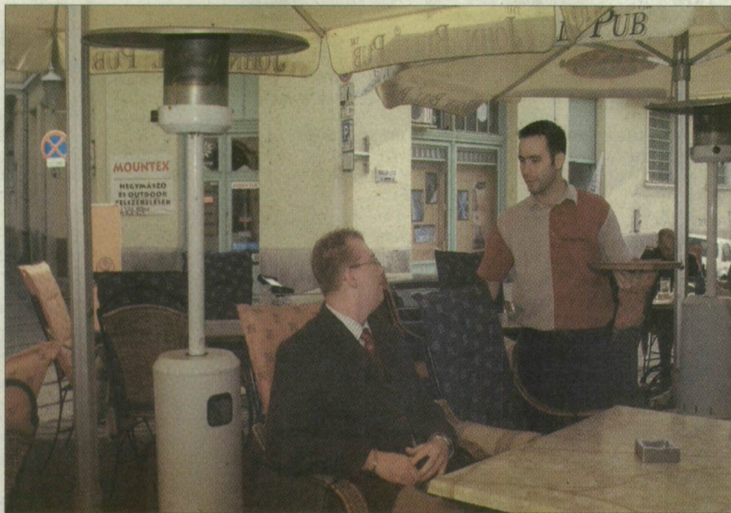
A hűvös nem akadály. A teraszokat fűteni is lehet