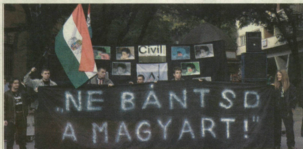
A „hatvannégyvarmegyes” fiatalok is csatlakoztak a tüntetőkhez