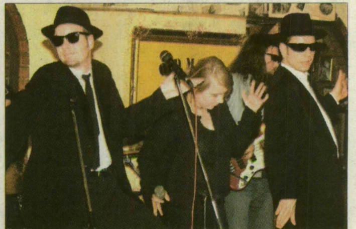
Nem akarják abbahagyni a „bohóckodást”

A zenekar a színpadon a Blues Brothers című film hangulatát idézi a film emblémájának számító öltözképpel, a betétdalokkal