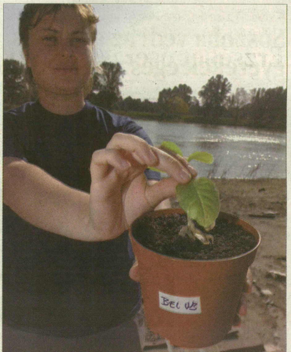
Dohánynövényklónokkal méri a káros ózon koncentrációját

Az egyesület és a szegedi önkormányzat közösen száz helyre, állványos tárolóhelyekre telepített dohánynövényklónokat – még júniusban. Ezeket havonta lecserelték és laboratóriumba szállították. A kiértékelés még tart. Várhatóan november végén elkészül egy károsózon-koncentrációt mutató térkép. Ennek alapján a laikusok is könnyen értelmezhetik a változásokat, a környezetre vonatkozó adatokat. A környezeti nevelési tanácsadó előljáróban elmondta: átlagos időjárási viszonyokat feltételezve a nyári hónapok közül az augusztusnak kellene a