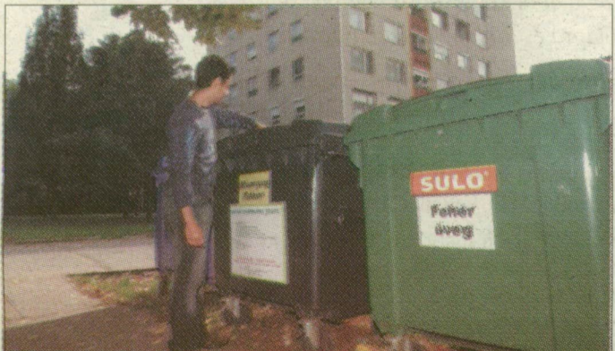
Négy gyűjtőhelyen helyezhetik el a szelektált szemetet

Műszerek helyett dohánynövényklónokkal mértek