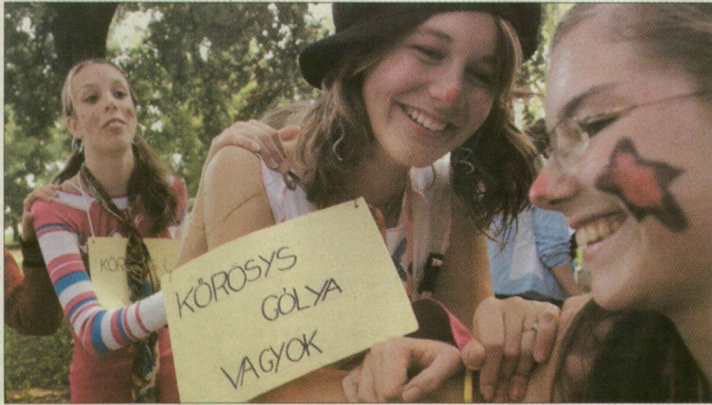
Vidám gólyalányok a Stefánián

Volt olyan osztály, melynek diákjait bohócok, másokat koldusnak vagy esőembernek öltöztettek a beavatást szervező tizedikesek. Egyik csapatban a lányoknak fiú-, a fiúknak lányruhát kellett öltetni. Vonulásuk közben időnként vécépumpával hajtott gördeszkára pattantak, vagy bekötött szemmel ették egymást joghurttal.