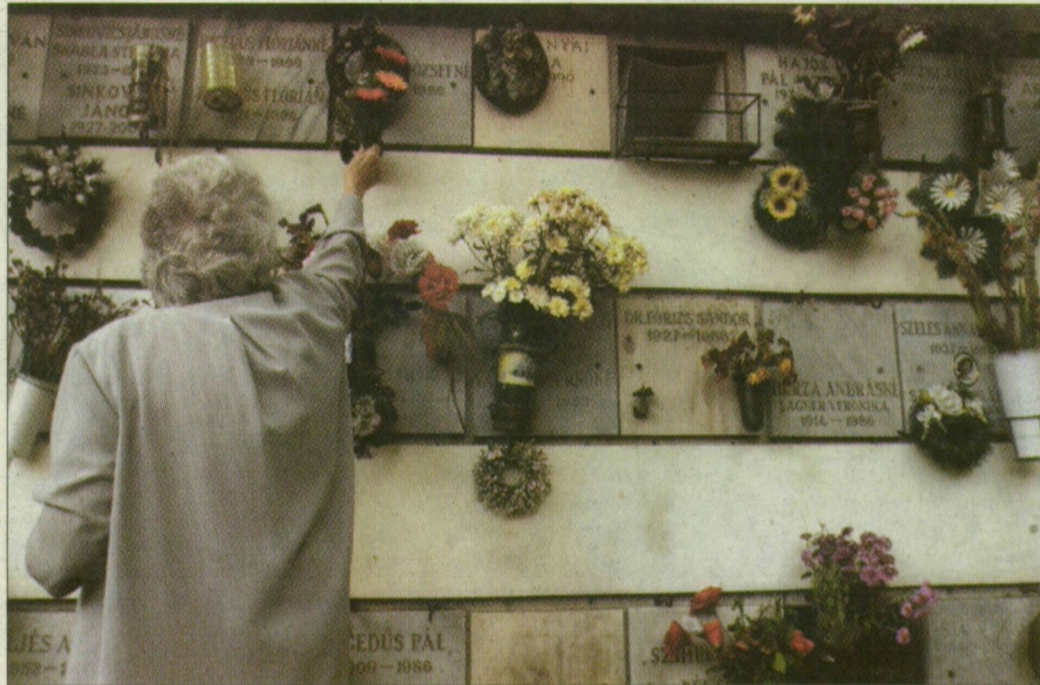
Csak hamvasztásos temetést tesz lehetővé a magas talajvíz

– Ez egy új passzus a temetkezési törvényben. Ugyanennek a jogszabálynak egy másik rendelkezése a sírgödör mélységét 200