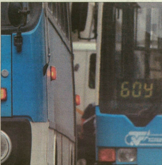
Járatsűrűség. A szám- és betűkódok elmagyarázta.

A szegedi autóbuszok szám- és betűjelzése sokak számára rejtély. Pedig a megfejtésből kiderülhet honnan és hová tart a járat, érinti-e a belvárost, vagy a körutakon közlekedik.