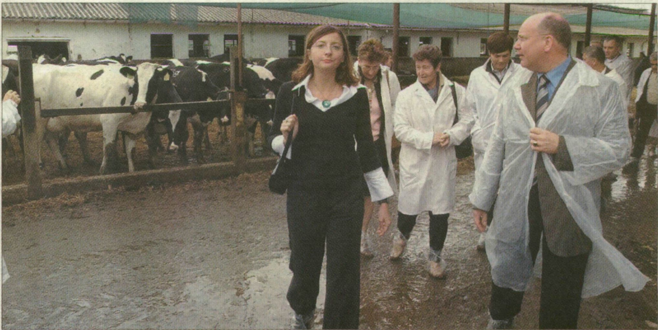
Az Európai Parlament szakbizottsága szemlét tartott a fábíáni Kinizsi 2000 Rt. tehenészeti telepén is