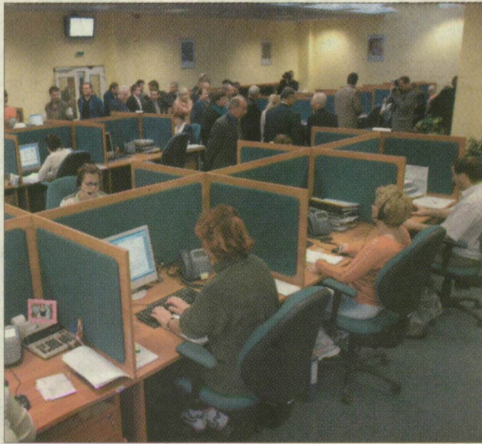
Az új telefonközpont egyszerre kilencven hívást tud fogadni

A Dél-alföldi és az Észak-dunántúli Gázszolgáltató Rt. új, közös telefonos ügyfélkapcsolati központot működtet ezentúl Szegeden, a Dégáz Pulz utcai központjában. Hétköznaponként reggel 6 és este 8 óra között fogadják az ügyfelek hívásait. A 40-824-825-ös helyi tarifával hívható számon be lehet jelenteni a mérőóra állását, lehet szolgáltatásokat megrendelni és lemondani, adat- és címváltozásokat bejelenteni, fogyasztási hely ki- és bekapcsolását intézni, illetve a számlázással kapcsolatos problémákat megbeszélni. A tegnapi avatónépszerűen részt vett Jean-Francois Carriere, a Gaz de France közép-európai igazgatója, aki elmondta: egy időben 90 telefonhívást tud fogadni a központ. Az ügyeket természetesen a továbbiakban is lehet személyesen is intézni.