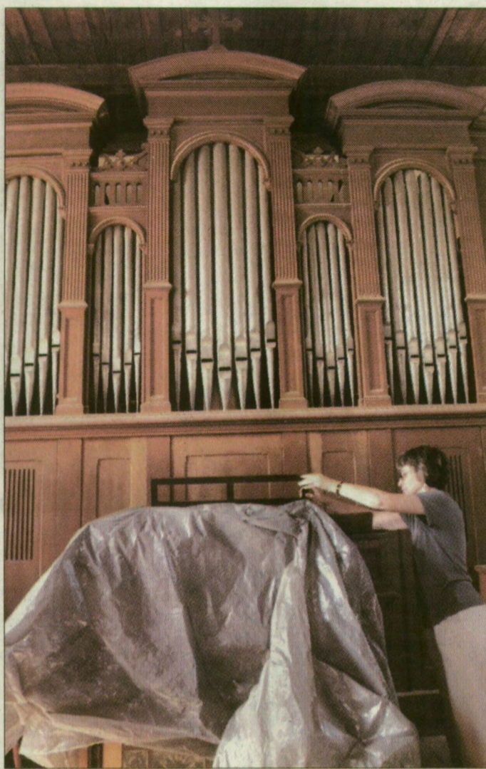
A petőfitelepi orgona nem műemlék, mert nem az eredeti helyén áll