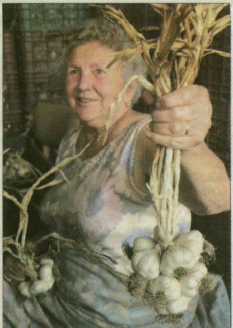
Az üzemen kézzel készülnek a sportolók ajándékai

vajdasági Óbecsén megrendezett kiállítás. Így most az akkori vendéglátók, illetve más szerbia-montenegróiak is eljöttek Vásárhelyre.