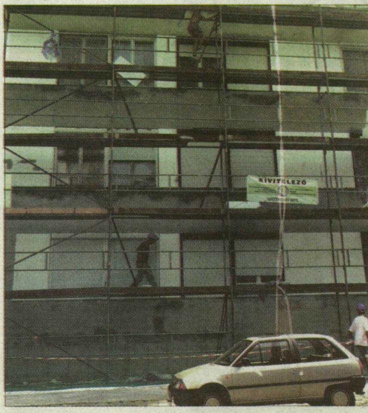
Fölállványozták a Tisza-parti Sellőházat