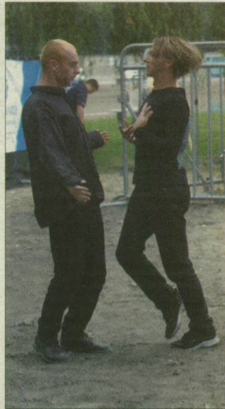
Ketten a SZIN-ről