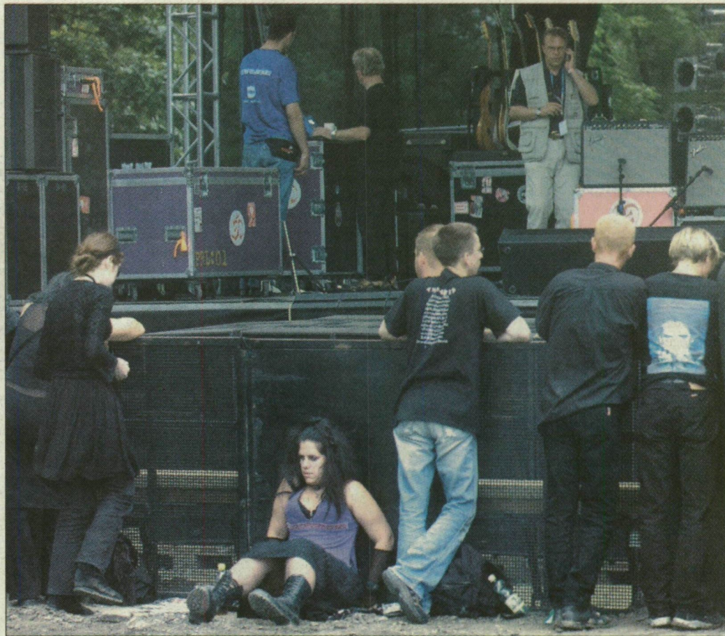
A rajongók már a délutáni hangpróbát is figyelemmel kísérték