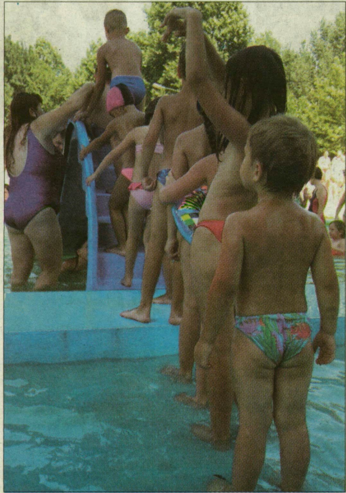
A legkisebbeknek is kedvenc helye az újszegei fürdő