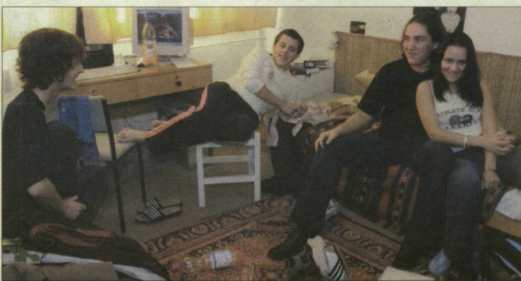
Édes élet a kollégiumban – szerencsés, akinek jut férőhely