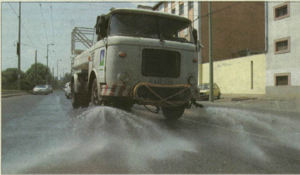
Nappal is locsolják az utakat