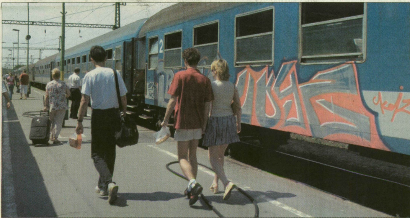
A szegedi pályaudvaron sem kímélik az önjelölt „művészek” a kocsikat