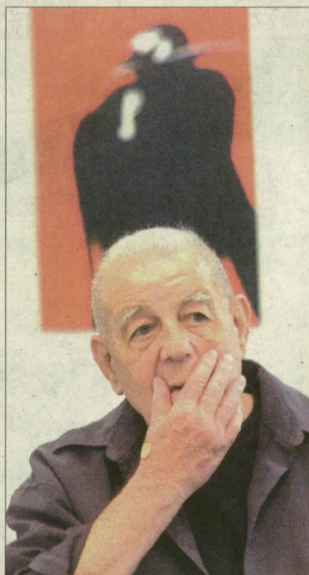
Kass János grafikusművész és a Kékszakálú a galériában

A jubileumi kiállításán Kass János ismert művei mellett barátai, tanítványai, családtagjai, szegedi művészbáratjai közül azon alkotóknak egy-egy művét mutatják be, akik az elmúlt két évtized alatt önálló tárlattal szerepeltek a kiállítóhelyen. Festmények, kerámiák, tűzománcok, textilek, kisplasztikák közzé kerülnek a kiállítóhely ünnepét.