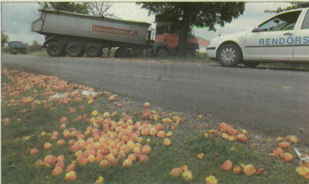
A barackot szállító csettegő vezetője súlyos sérüléseket szenvedett

Egy sódert szállító nyerges vontató haladt tegnap késő délelőtt Bordány felől Szeged irányába, amikor – a rendőrség adatai szerint – valószínűleg későn vette észre az előtte haladó, barackot szállító lassú járművet, és nekiütközött. A teljesen összetört barackszállító csettegőt vezető bordányi férfi súlyos sérüléseket szenvedett. A férfit a szegedi II-es kórházba szállították. A tehergépkocsi a karambol miatt a bal oldali árokba roham, és egy fának ütközött. A helyszínelés idejére az utat teljes szélességében lezárták, mivel a szétszóródott barackot össze kellett szedni. Míg a teherkocsi rakományát átpakolták, késő délutánig csak az egyik sávban lehetett közlekedni.