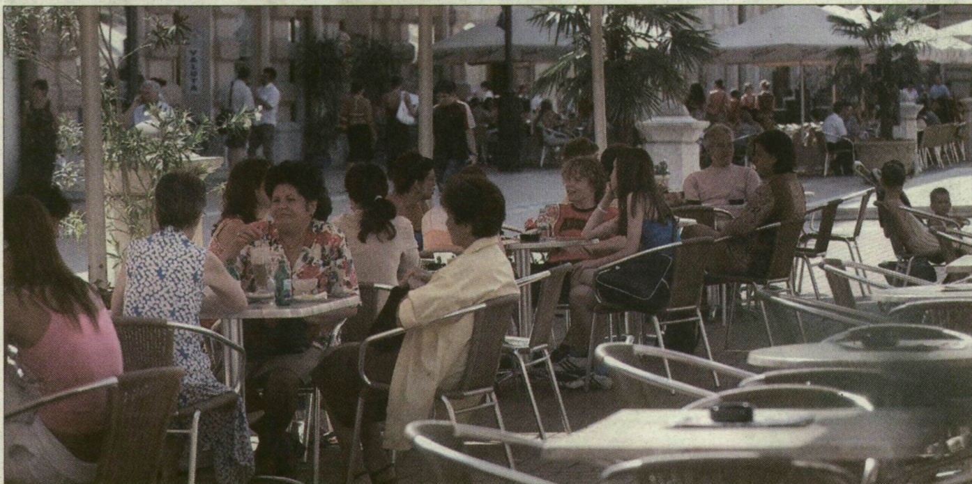
Terasz terasz hátán a szegedi Klauzál téren. A belvárosi árak „tartalmazzák” a mediterrán hangulatot is