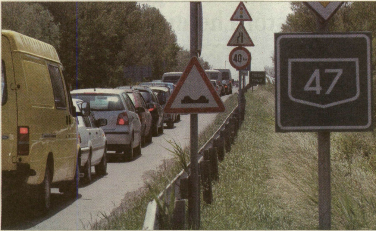
A sorban veszteglő autósoknak marad a várakozás és a mérgeződés