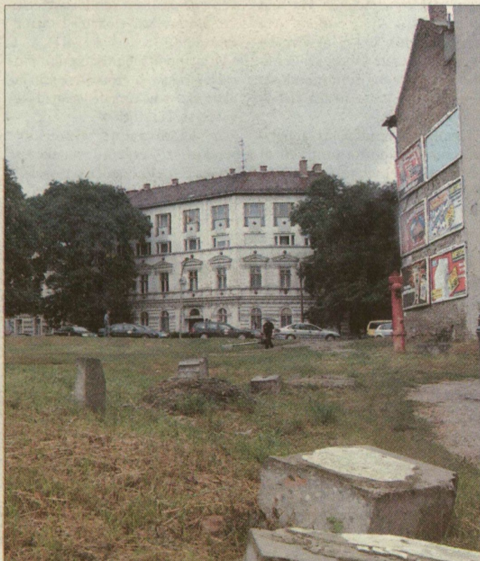
A „profilkötött” ingatlan ára 150 millió forint