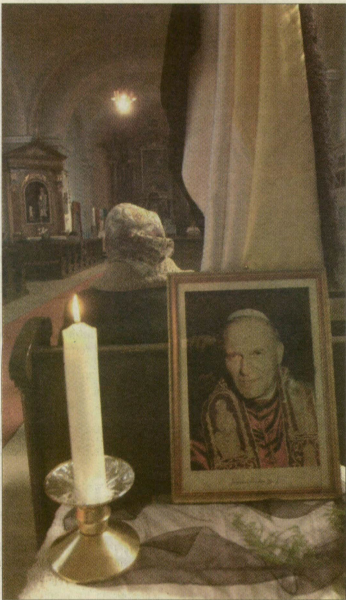
Április: a kisteleki templomban II. János Pál pápa halála után