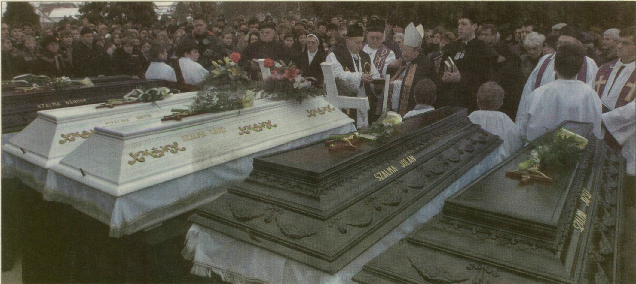
Február: Horgoson eltemették a meggyilkolt hattagú Szalma családot