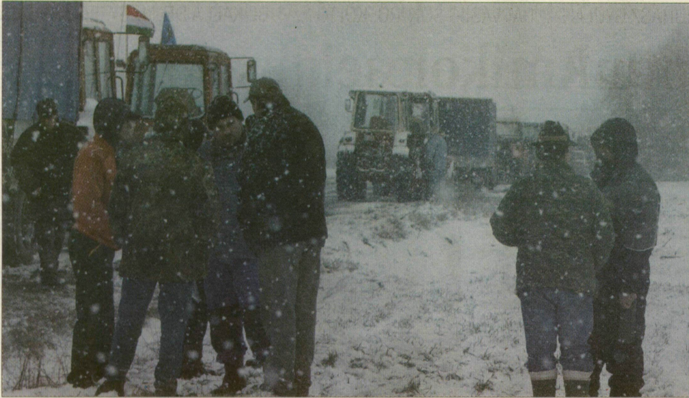
Február: gazdatüntetés Mórahalmon és Budapesten