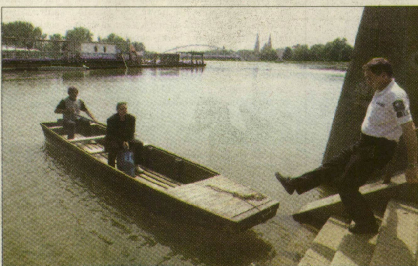
Ha lépésben is, lassan levonul az árhullám a Tiszán