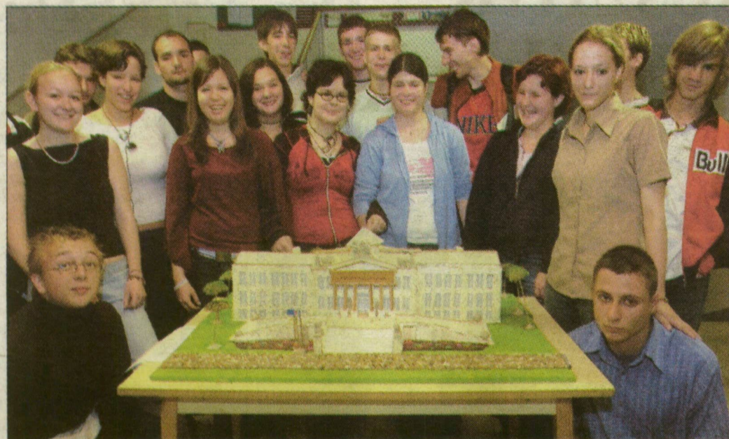
A győztes csapat és mini múzeum