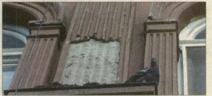
Az Oskola utca 16. számú épületet tavaly novemberben adta el az önkormányzat.

Túl sokba került volna a fölüjtás, ezért a szegedi önkormányzat – három másik épület mellett – az Oskola utca 16. számú házat is eladta. Az épület ma lakatlan, vakolata hullik, homlokzatát vastagon borítja a madárpiszok. Az új tulajdonosnak két éven belül kell fölüjtania az ingatlan.