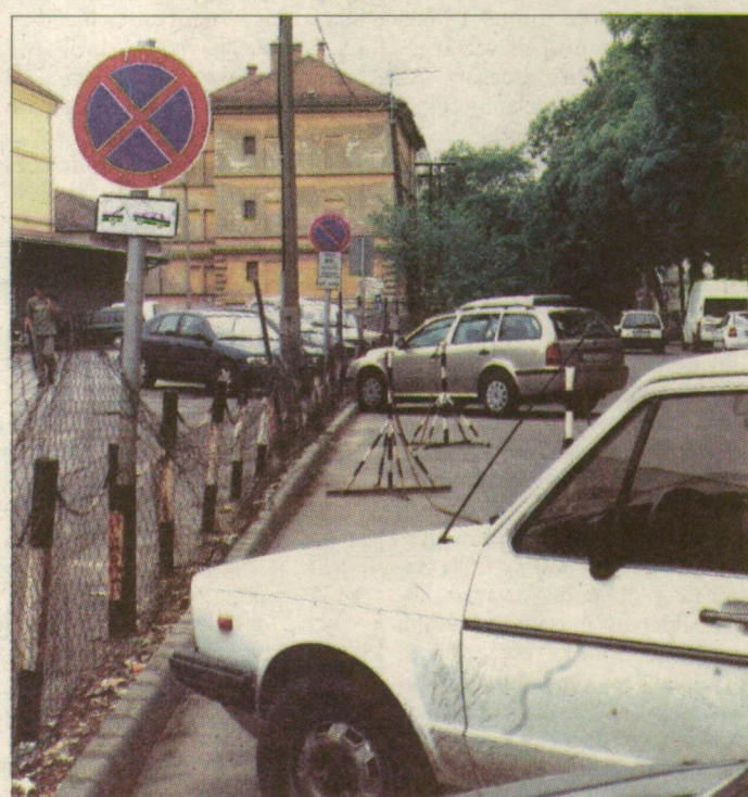
A drótkerítés nem oldja fel a tiltást