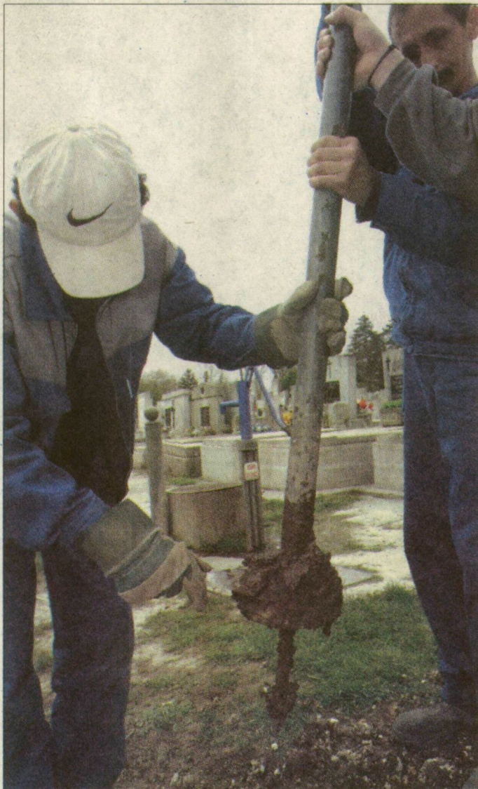
A Dugonics temetőben is próbafúrásokkal ellenőrzik a talajvíz szintjét