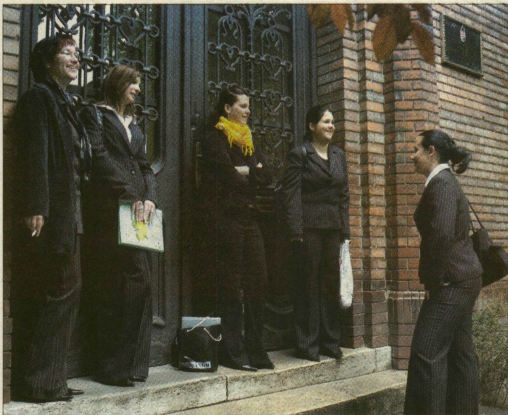
Álljt parancsoltak az érettségi csalásnak a tömörkényis lányok