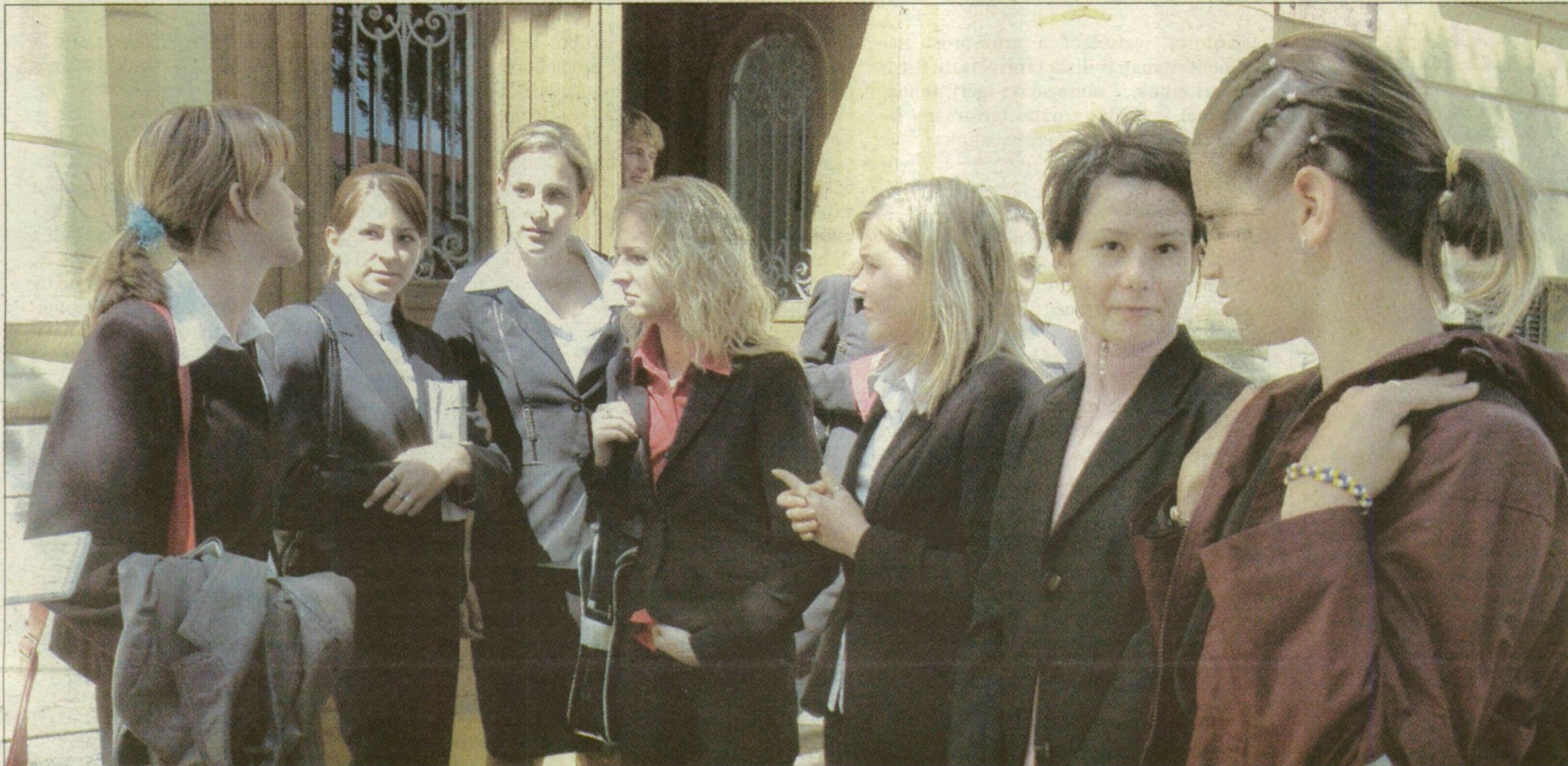
Szegedi radnóti diákok matematika írásbeli után. Őket is nyomasztja a bizonytalanság