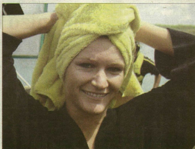
Janics örül, hogy túl van a forgatáson