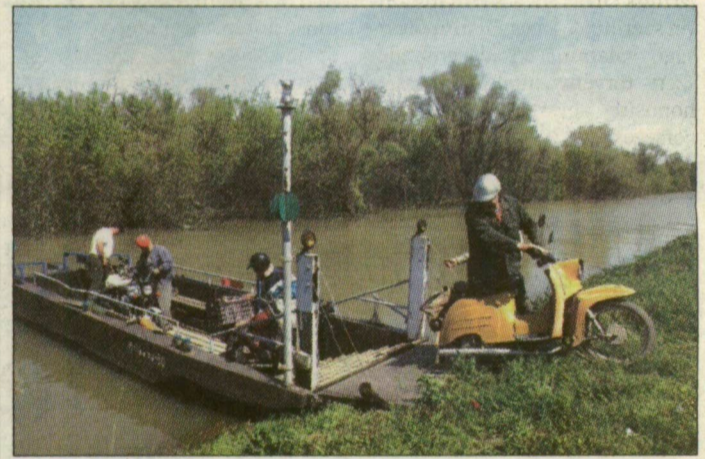
A gyalogosok-motorosok dereglyén is átjuthatnak a túlpartra Tápénál