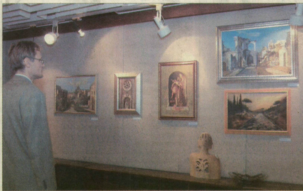
A képek lenyűgözik a látogatókat