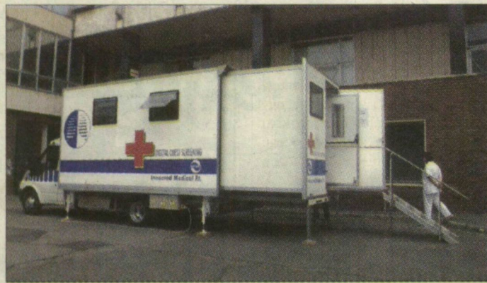
Ehhez már nem kell se film, se vegyszer, és sokkal kisebb sugárterhelés éri a páciens