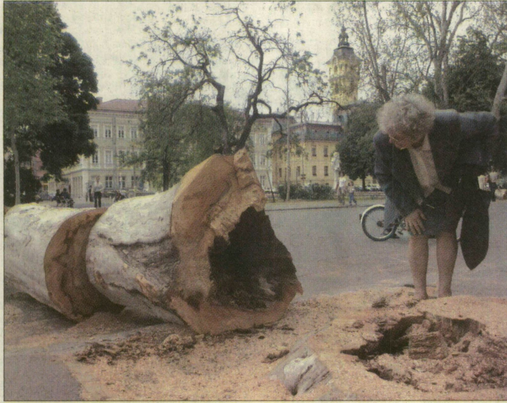
A Széchenyi téren a szegediek is megtekinthetik a kivágott fákat