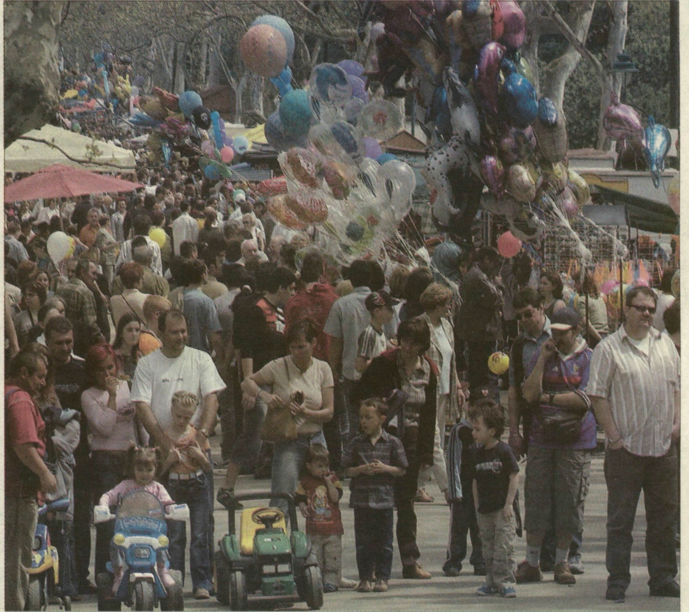
Lufi- és emberáradat a ligetben