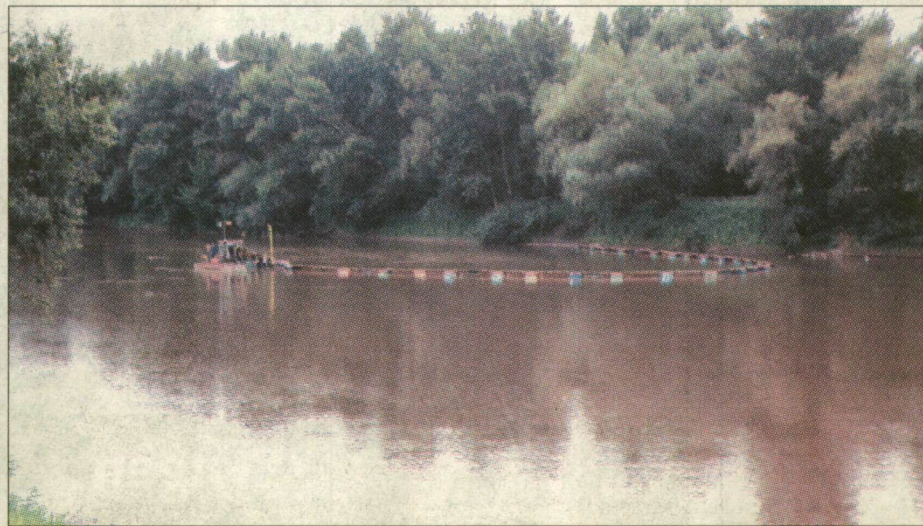
Maros. A két universitas együttesen tárja föl a megóvandó értékeket

A négyéves programnak külön, további hozadéka: a két egyetem ökológiai tanszékei szoros kapcsolatba kerültek egymással – oktatók, hallgatók vesznek részt a legkülönbözőbb közös programokban.