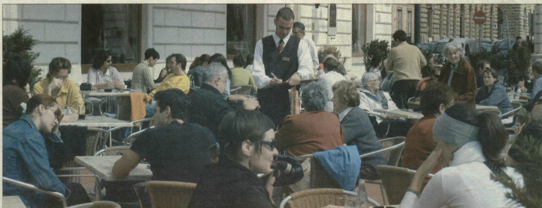
Vendégek a Virág teraszán. Kiürülhet a tér