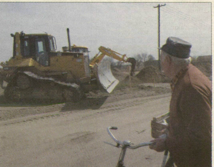
Hatalmas gépekkel ismerkednek a környékbeliek

A péntekig hátralévő napokban a koalíció valószínűleg meg egyezik majd, hiszen egyik pártnak sem érdeke, hogy a Fidesz szerephez jusson az elnökválasztásban. Ennyi áll érdekükben: az SZDSZ-nek a saját befolyás megmutatása, Gyurcsány Ferencnek az, hogy ne Szili Katalin legyen a jelölt, az MSZP-nek pedig az, hogy mégis saját jelöltje legyen elnök. Ha minden így marad – és a jelölési vitába nem keverik bele a budapesti főpolgármester-jelöltséget –, akkor az eddigi ismeretek szerinti második vonalbeli szocialista jelöltnek, Glatz Ferencnek és Bórándy Péternek van a legtöbb esélye a jelöltségre.