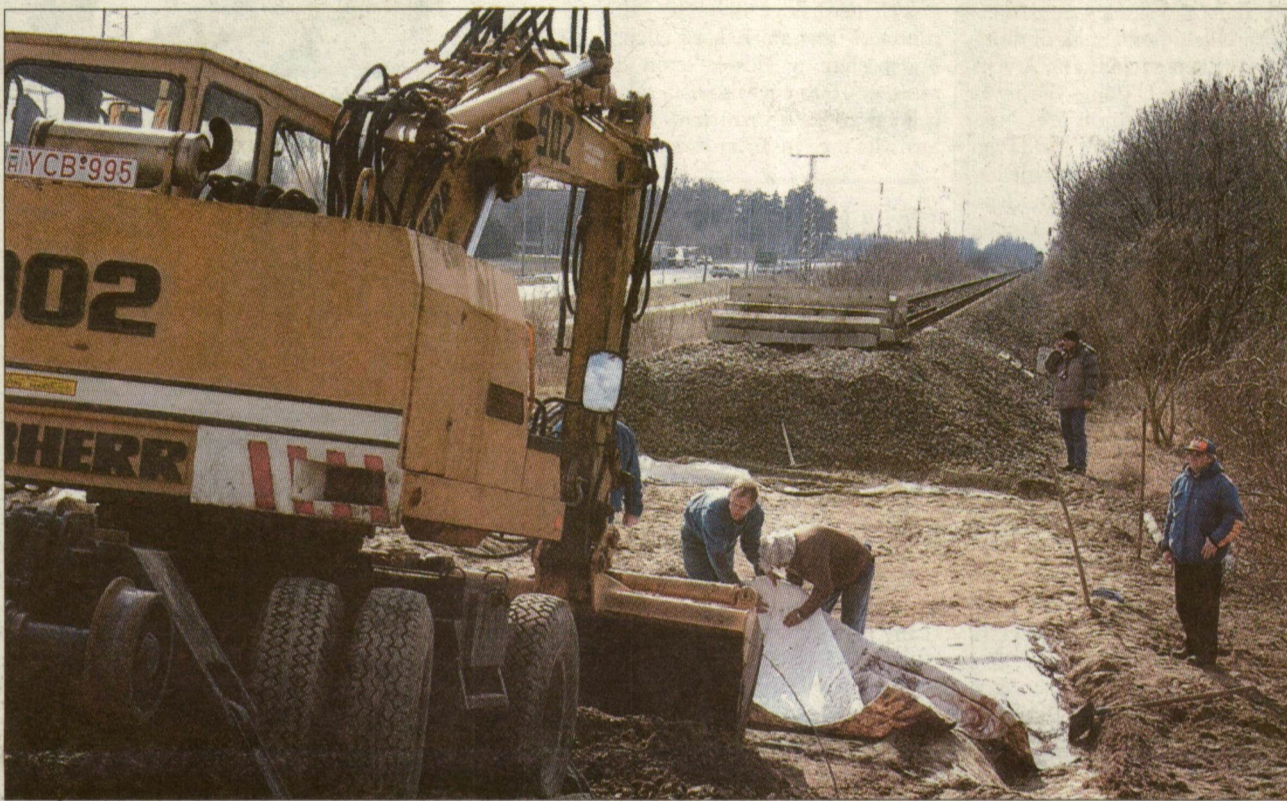
Várhatóan húsvétra végeznek a töltés helyreállításával a nagyállomás és a Népkert közötti szakaszon