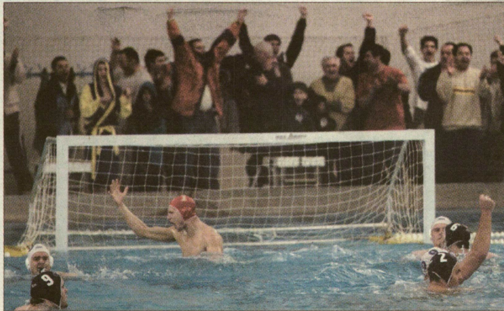
Barát utolsó védése után együtt örültek a szurkolók a játékosokkal