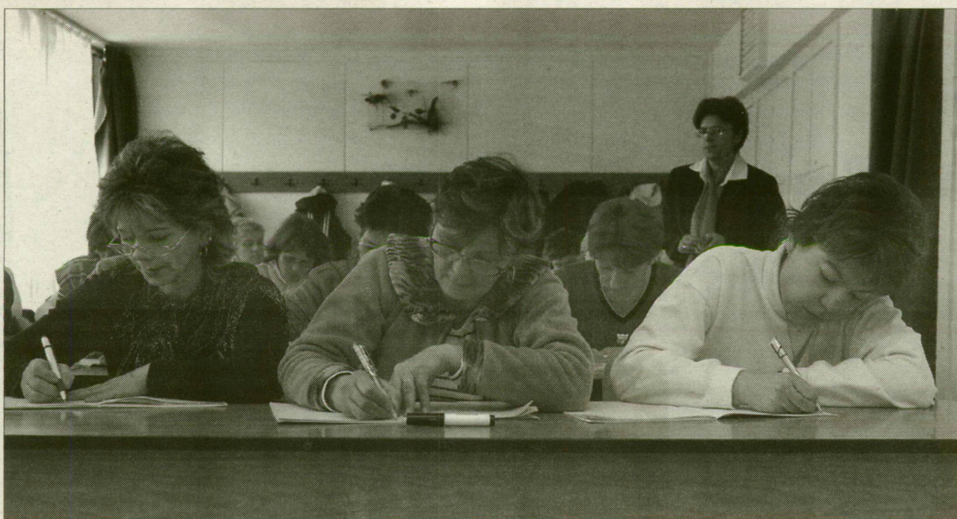
A komoly képzések biztosan nem csak néhány órák, és a tanulás feltételeit is biztosítják

Egy betéti társaság például hamarosan induló masszázstanfolyamához toboroz résztvevőket Szegeden. Azt ígéri, a mindössze 16 órás képzés elvégzése munkavállalásra jogosít. Azaz: négy hétfője alatt, alkalmanként négy óra után az itt végzetek otthonukban vagy mászol más emberek testével foglalkozhatnak. Tóth Anikó masszázshosszabb kurzus. Erdei János