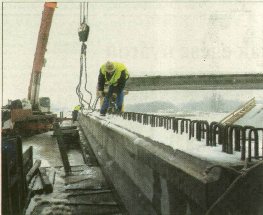
A hidépíték a márciusi fagyban is dolgozhatnak