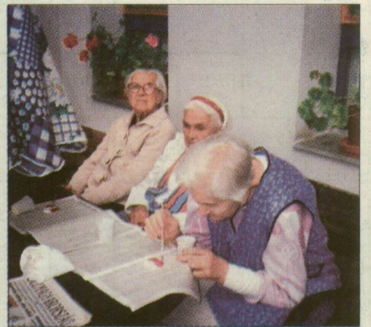
Békés életkép az otthonból

A szeretetotthonban a napi program szabadon választható. Aki szeretné, reggeli után közös imádságon vesz részt, majd a foglalkoztató nővér felolvas valamilyen tanulságos történetet. A könyvek sorában az Erőleves a léleknek című kedvelik a legjobban. A gyógytestnevelés egyik nap a mozgásukban korlátozottakat edzi, másik nap a többiekkel gyakoroloznak a tornaszobában. A foglalkoztató nővérek a gondozottakkal sétálnak és kirándulni járnak, az otthon falai között pedig többnyire egyházi énekeket tanulnak és kézimunkáznak. A napokban tartották a farsangot. Ebéd után csendes pihe-