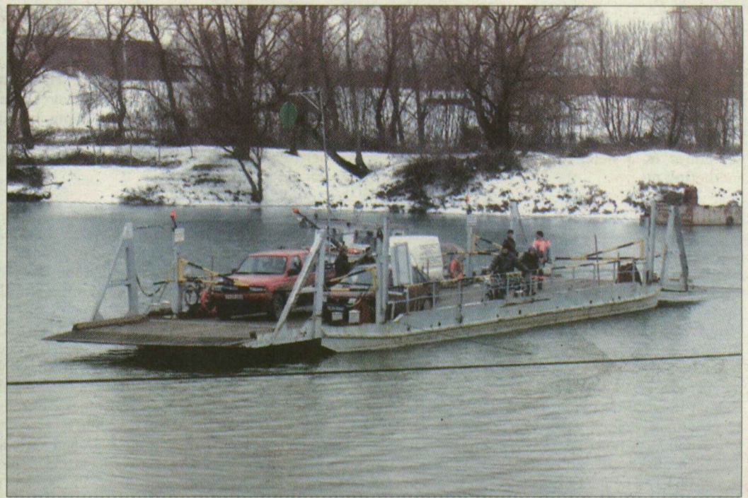
Ha megindul a jégzajlás, már a komp sem közlekedhet