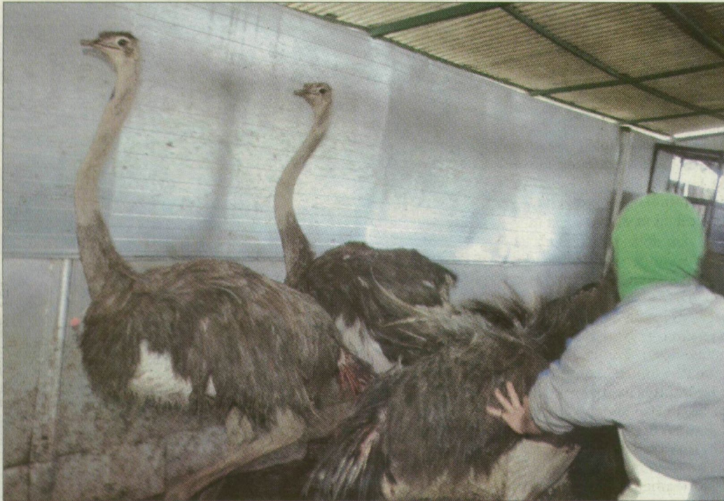
Vágóhídon a hatalmas madarak

Amikor nem tudták eladni a tenyésztett madarakat, a helyi hatóságok segítségét kérve, struccvágóhidat építettek. Ennek költségeiről nem kívánt nyilatkozni az ügyvezető, annyiban maradtunk: milliós nagyságrendű volt. A Kukori Kft. vágóhídját Magyarországon és a régióban is egyedülálló, hiszen csak őket vette fel a