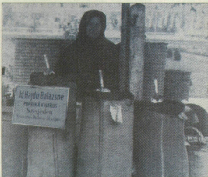
Paprikaárus. A fűszer forgalma szabadabbá lett

Májusban lesz 95 éve, hogy megjelent lapunk, a Délmagyarország első száma. Az évforduló alkalmából egy kis múltbeli kalandozásra hívjuk olvasóinkat. 95 lapszámon át szemelvényeket közlünk a 95 évfolyam fontos és érdekes írásából. És bár az ilyen válogatások szükségképpen esetlegesek, bízunk benne, hogy olvasóink örömeiket lelik benne, és betekintést nyernek nemcsak az ország és Szeged közel egy évszázados történelmébe, hanem a Délmagyarország történetébe is.