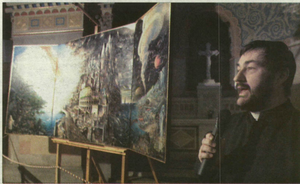
Szabó András szárnyas oltárra rengetegen voltak kíváncsiak