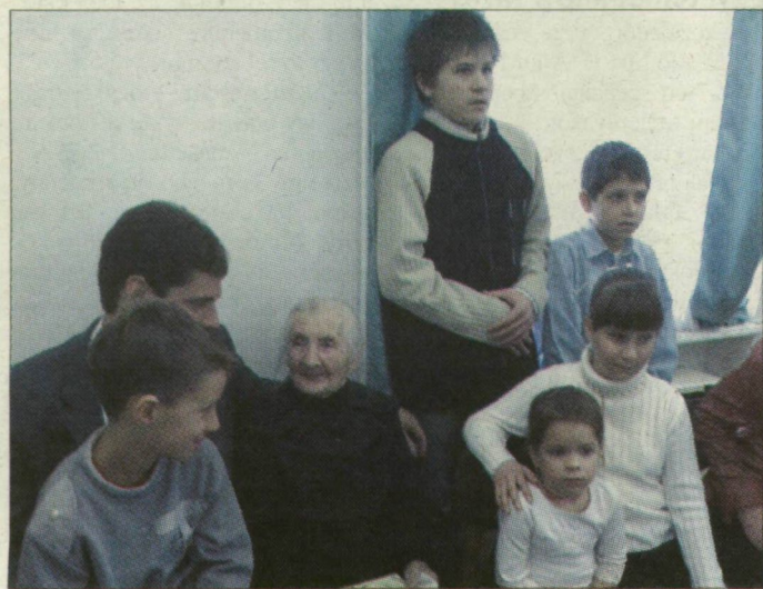
Marika néni és a dédunokák