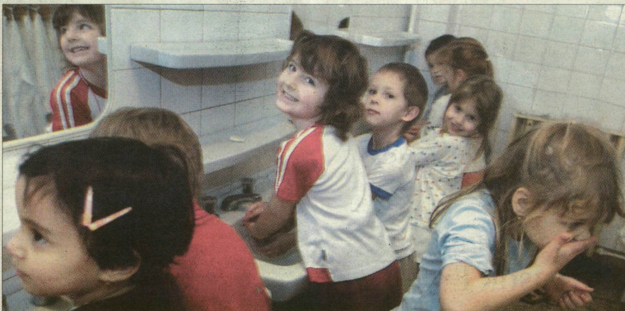
A SZOTE-óvodára is bezárás vár

A Pick a tervek szerint nem csak a gyerekeket, hanem óvónőiket is átvenné, ám néhány állás akkor is megszűnne.