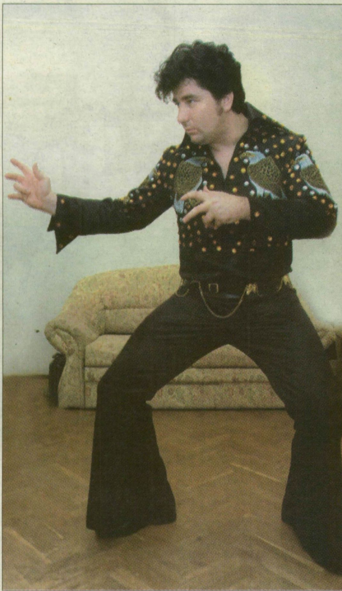
Vajon Presley mit szólna szegedi utánzójához?

A „szegedi Elvis” itthon is vállal fellépéseket, igaz, a briteknél háromszor annyit fizetnek neki egy-egy produkcióért, mint Magyarországon. Mással azonban nem foglalkozik, a honoráriumokból bőven megél. Nem szégyelli bevallani „Elvis, Várkonyi”, hogy nem ismeri az összes, mintegy 700 Elvis-dalt. A szöveget azonban mindegyiknek megszerzte. Varratott fehér és fekete fellépő ruhát, flitterest – V-kivágású inggel, trapéz nadrággal, majd színben hozzá illő cipőt választott, és persze a frizurát is egy