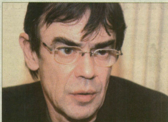
– A házimozis jelentik a nagy kihívást