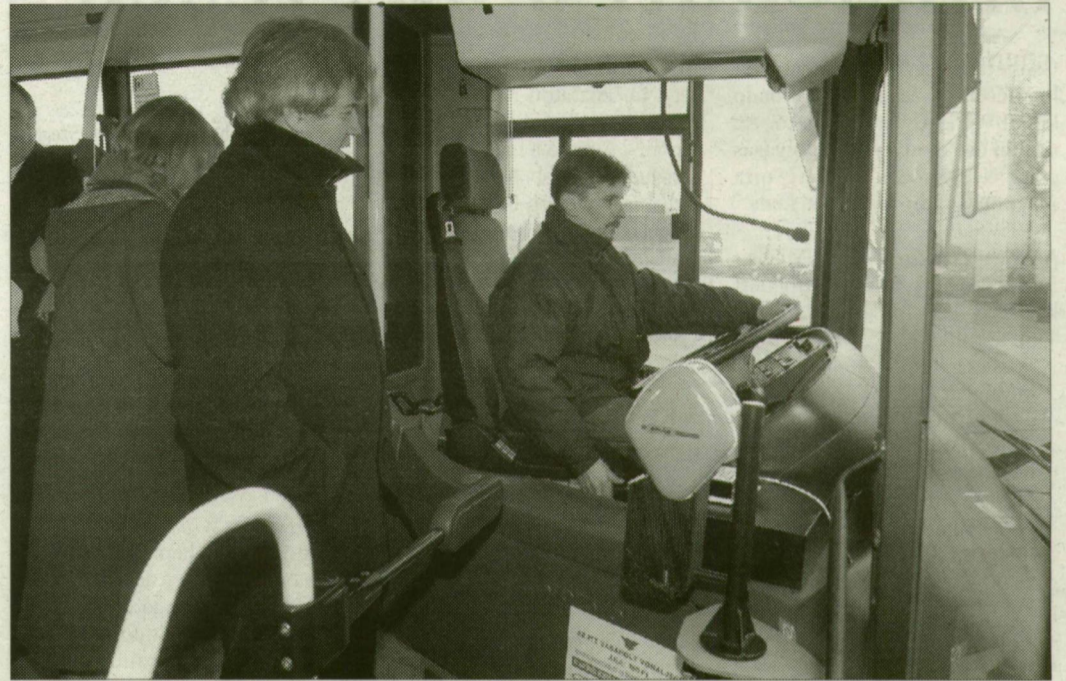
A Tisza Volán korszerű, alacsony padlójú buszokat vásárolt.