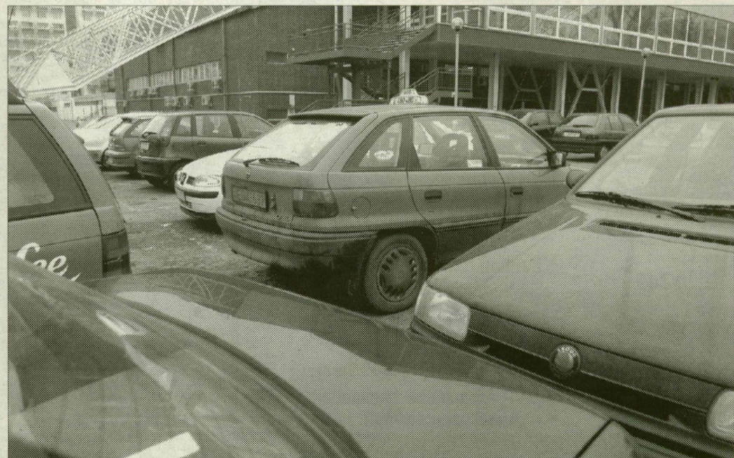
Parkolási káosz az újszegedi sportcsarnoknál.